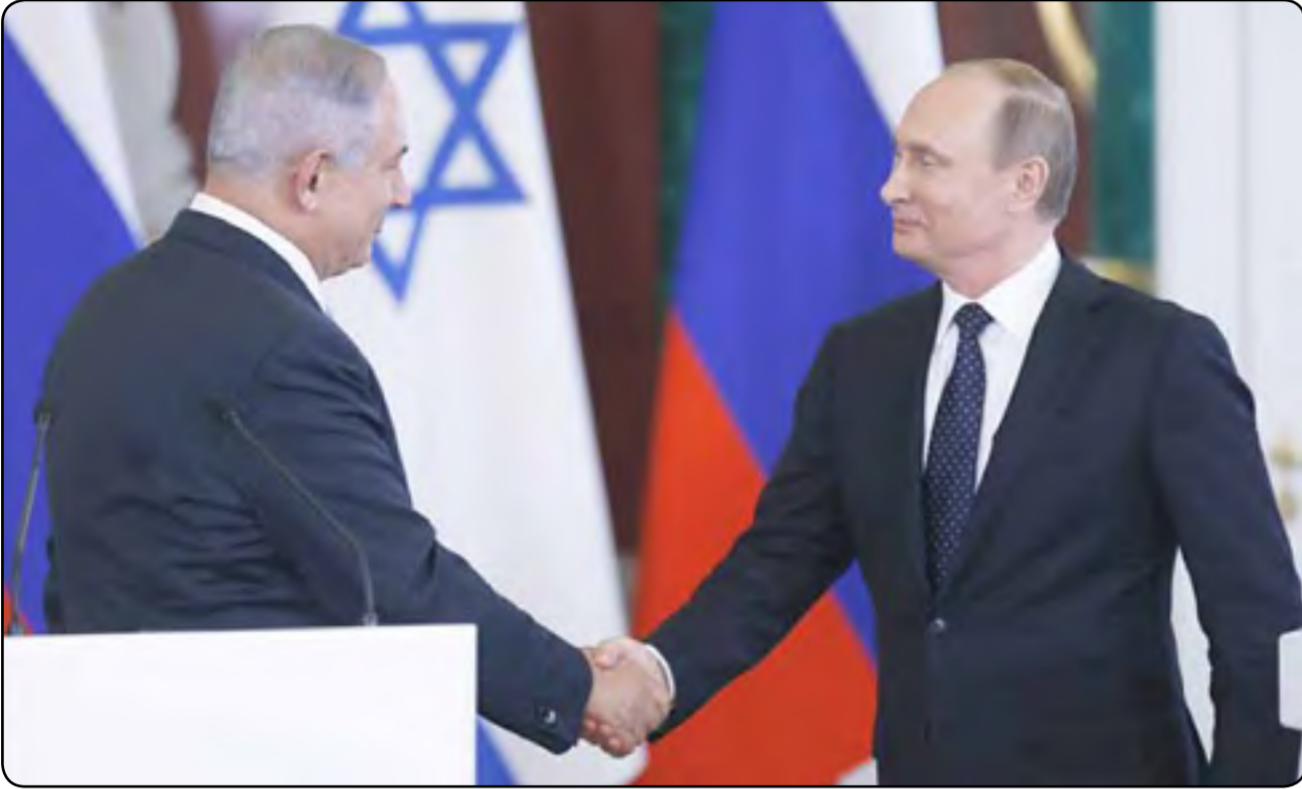
روسيا وإسرائيل، العلاقة الحارة.

*تحليلات: العلاقات الإسرائيلية - الروسية تسير على خط منهجي متواصل من التعميق والتعزيز منذ العام ٢٠٠٩ لكنّها شهدت فقرة نوعية وكبيرة على خلفية التدخل الروسي العسكري النشط في كل ما يجري على الساحة السورية*