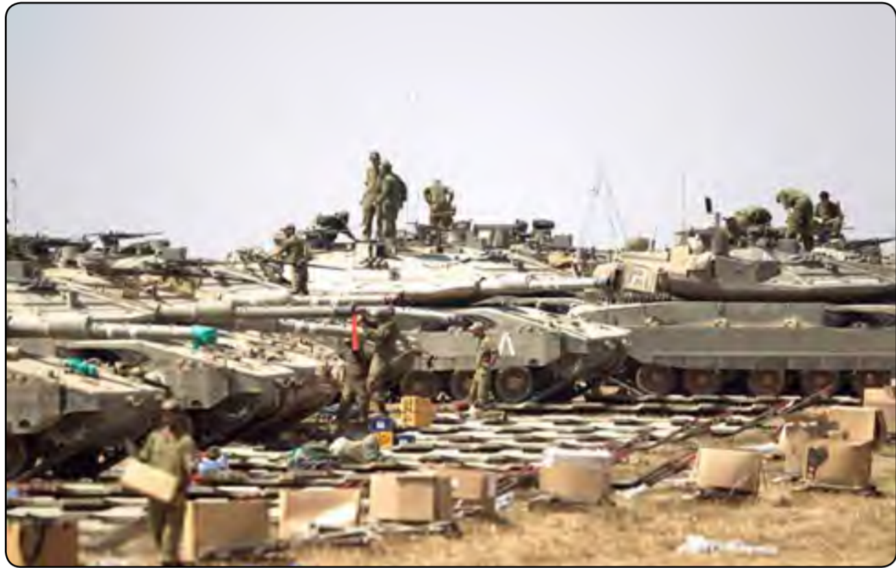
قبالة غزة ذات عدوان.

على سبيل المثال، نشرت صحيفة «هآرتس» الإسرائيلية يوم الأحد ٣٠ تشرين الأول، خبراً يفيد بأن معهد التطبيقات الهندسية «التخنيون» في حيفا، الذي يعد