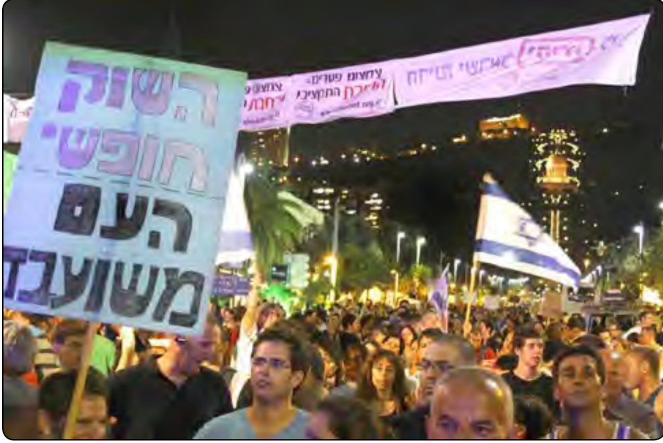
اسرائيل: تدهور اجتماعي متواصل.

* إسرائيل تعيش واقعا مثيرا لليأس وعلى الجيل الشاب أن يستيقظ، قبل فوات الأوان!*