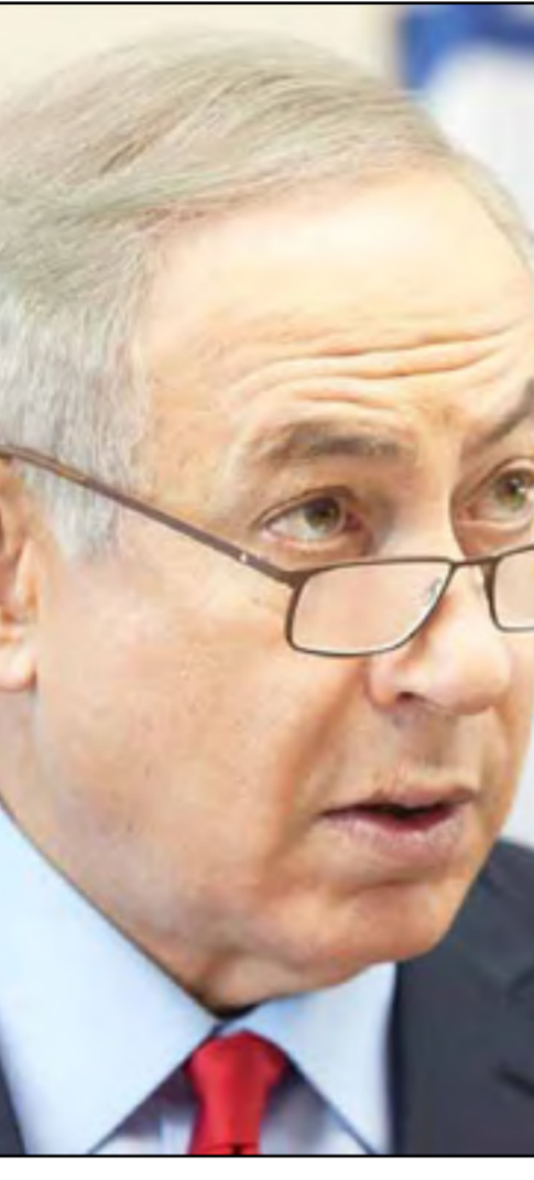
نتنياهو، سؤال ما بعد الانتخابات الأميركية.

*نتنياهو واليمين الإسرائيلي المتشدد التزما الصمت في حملة الانتخابات الأميركية الجارية رغم تدخلهما المعلن في العام ٢٠١٢ ضد أوباما والحزب الديمقراطي* يبدو أن هناك حالة شبه استسلام لنتيجة انتخابات الرئاسة الأميركية ما دفع نتنياهو لتمرير رسائل سياسية إلى كلينتون*